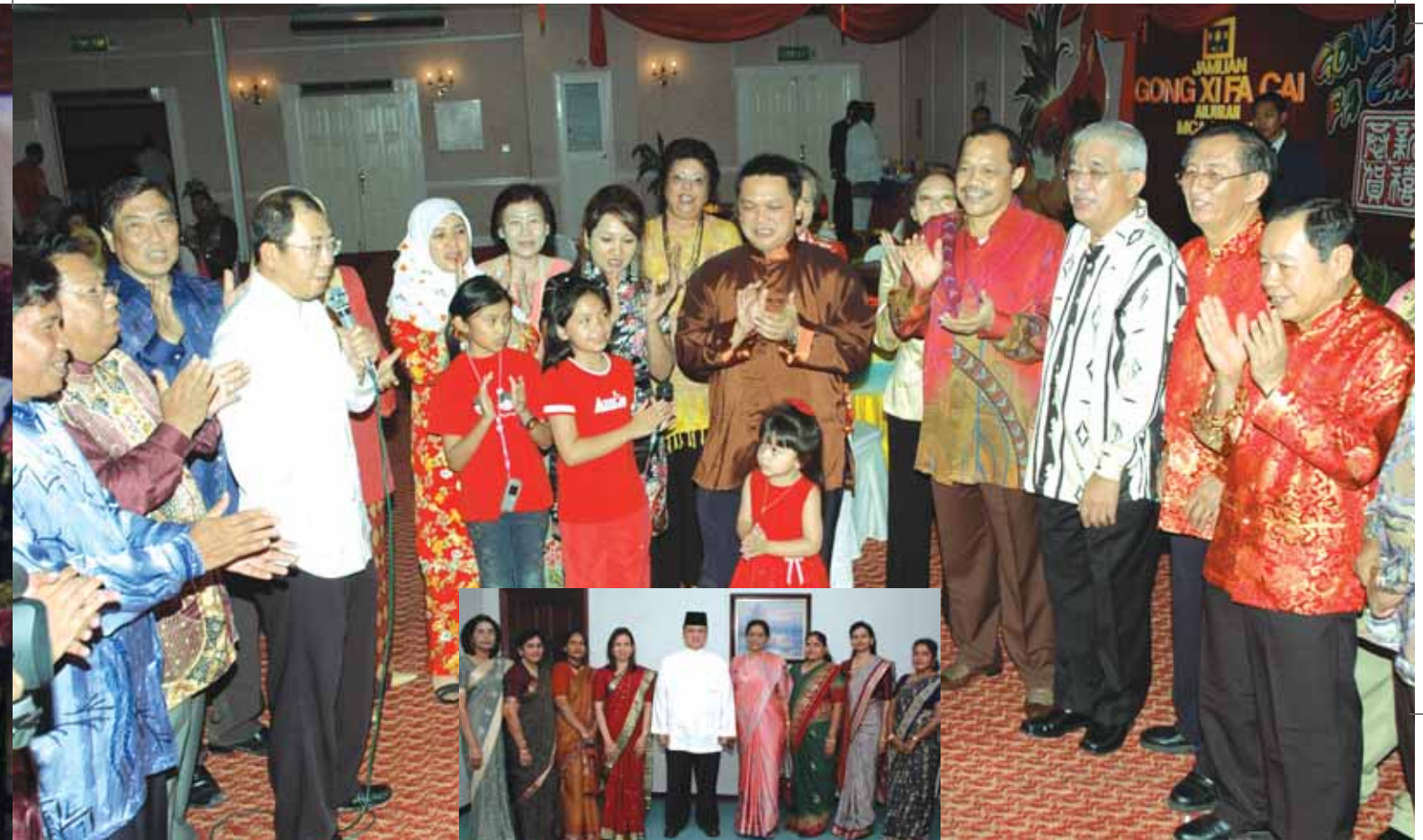
Pemimpin MIC Wanita