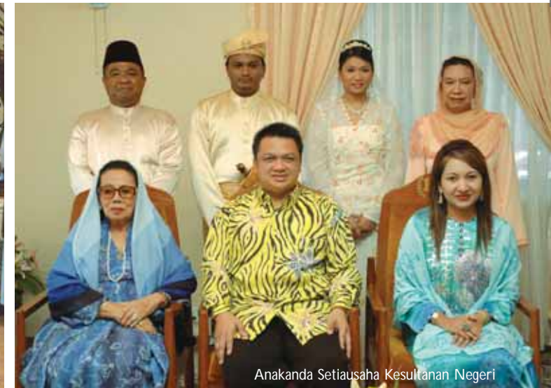
Anakanda Setiausaha Kesultanan Negeri