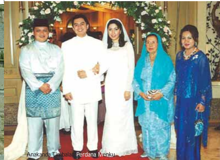
Anakanda Timabalar Perdana Menku

DYMM Tuanku Pemangku Raja dan DYTM Raja Puan Muda Perlis mempunyai ramai kenalan samada di dalam mahu pun di luar negara. Baginda berdua sentiasa berangkat mencemar duli menunaikan undangan dan hajat mereka bagi menyerikan majlis meraikan perkahwinan ahli-ahli keluargamereka.