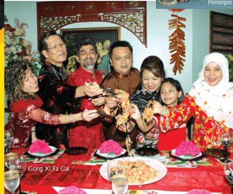
Gong Xi Fa Cai