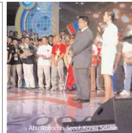
Abu Robocon, Seoul, Korea Selatan