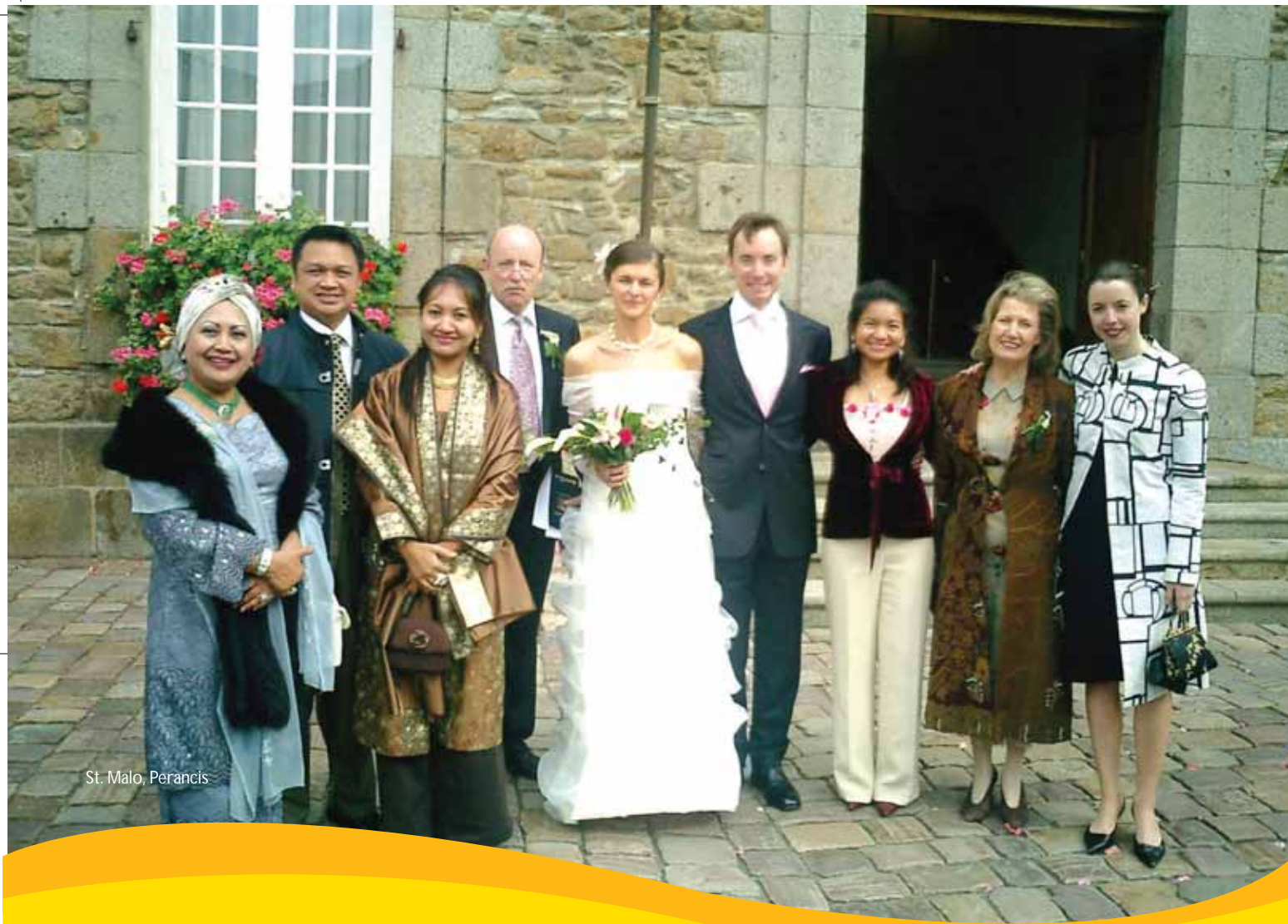
St. Malo, Perancis

DYMM Tuanku Pemangku Raja dan DYTM Raja Puan Muda Perlis mempunyai ramai kenalan samada di dalam mahu pun di luar negara. Baginda berdua sentiasa berangkat mencemar duli menunaikan undangan dan hajat mereka bagi menyerikan majlis meraikan perkahwinan ahli-ahli keluargamereka.