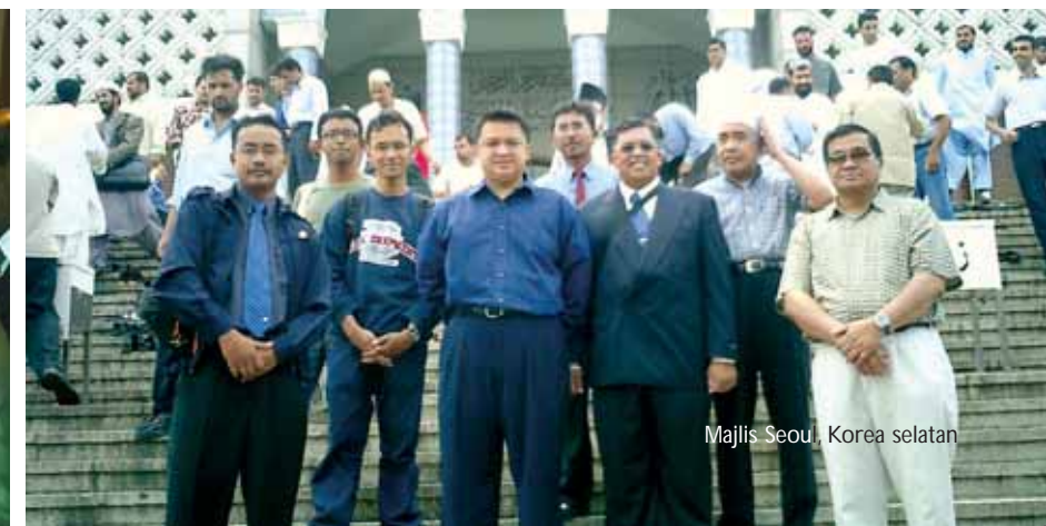
Majlis Seoul, Korea selatan