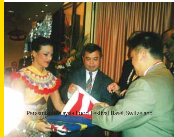
Perasmian Malaysia Food Festival Basel, Switzerland

DYMM Tuanku Pemangku dan DYMM Tuanku Raja Puan Muda Perlis telah berkenan berangkat ke beberapa acara di peringkat antarabangsa. Umpamanya, baginda telah mengetuai delegasi filem Puteri Gunung Ledang ke Festival Filem Antarabangsa di Venice Itali, mengetuai rombongan KUKUM ke pertandingan robot Robokon anjuran Asian Broadcasting Corporation (ABU) Asia Pasifik di Seoul, Korea Selatan. Baginda juga berkenan berangkat sebagai tetamu di Raja untuk merasmikan Festival Kebudayaan dan Makanan Malaysia di Basel, Switzerland. Baginda turut merasmikan perayaan ulangtahun Ejen Penjualan Am Sistem Penerbangan Malaysia di Colombo, Sri Lanka. Kesudian Baginda berdua berangkat meluangkan masa mencemar duli ke majlis-majlis tersebut jelas meletakkan negeri Perlis di persada peta dunia.