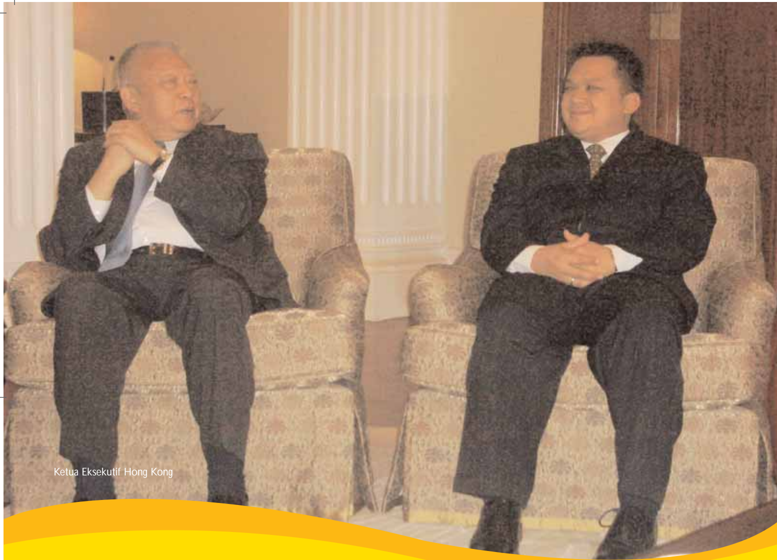
Ketua Eksekutif Hong Kong